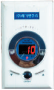
Digital Termostat 4 kW( max)

EN EKONOMİK... Tam gün çalışmaz. Namaza 5 dakika kala açılması halıların ısınması için yeterlidir. Günde en çok 1 saat devrede kalır.